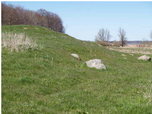
En del randsten omkring højen på toppen og ved bakkens fod.