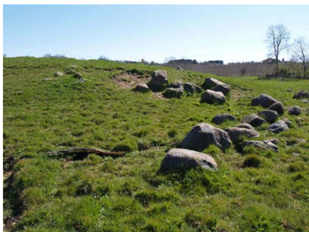
En del sten på højens vestside.

Gravhøj fra bronzealder eller ældre jernalder. 10 x 10 x 1 m. med enkelte randsten. Højen er overpløjet og har flad top. Den ligger på en tidligere ø i eng tæt på Isefjord. Engen er nu med varigt græs, da den er vandlidende.